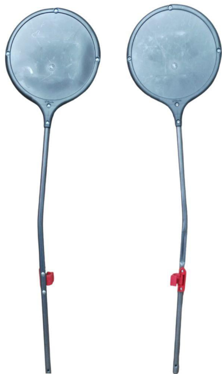
Haste de identificação (pirulitos)