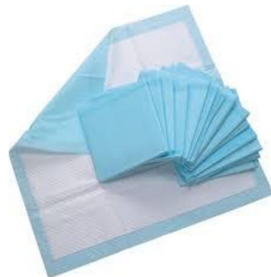
Tapetes Higiênicos para pets