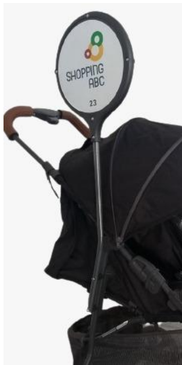
Adesivos numerados + logo do shopping